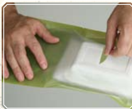
4. Быстро загните верхнюю часть пакета и приклейте ее с помощью липкой ленты для фиксации пакета в сложенном состоянии.