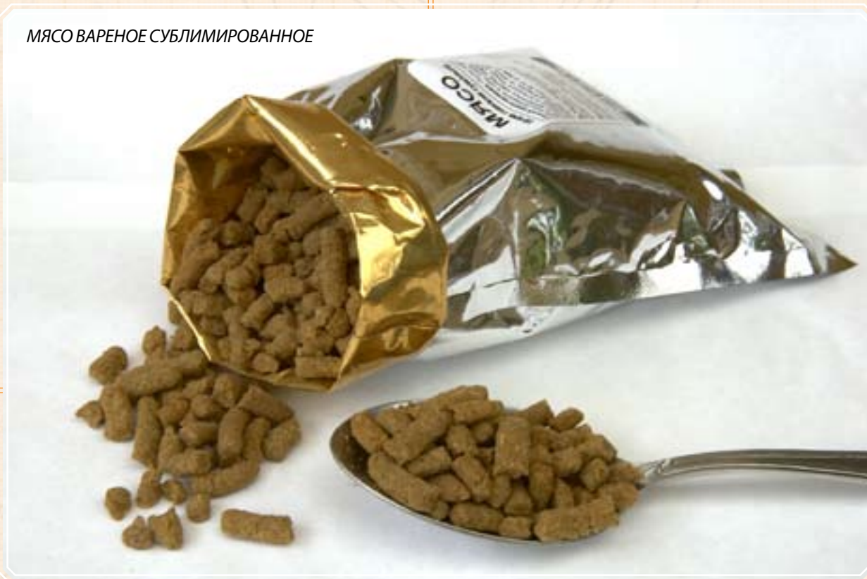
МЯСО ВАРЕНОЕ СУБЛИМИРОВАННОЕ