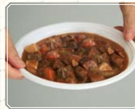
6. Через 10-12 минут еда разогрета и готова к употреблению.