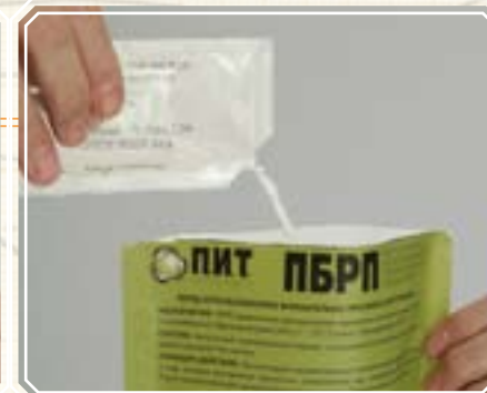
3. Добавьте 40-45 мл воды, необходимой для начала процесса разогрева.