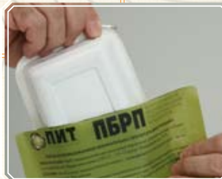
2. Вложите емкость с едой.