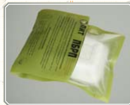
5. Положите пакет загнутым концом вверх на горизонтальную поверхность.